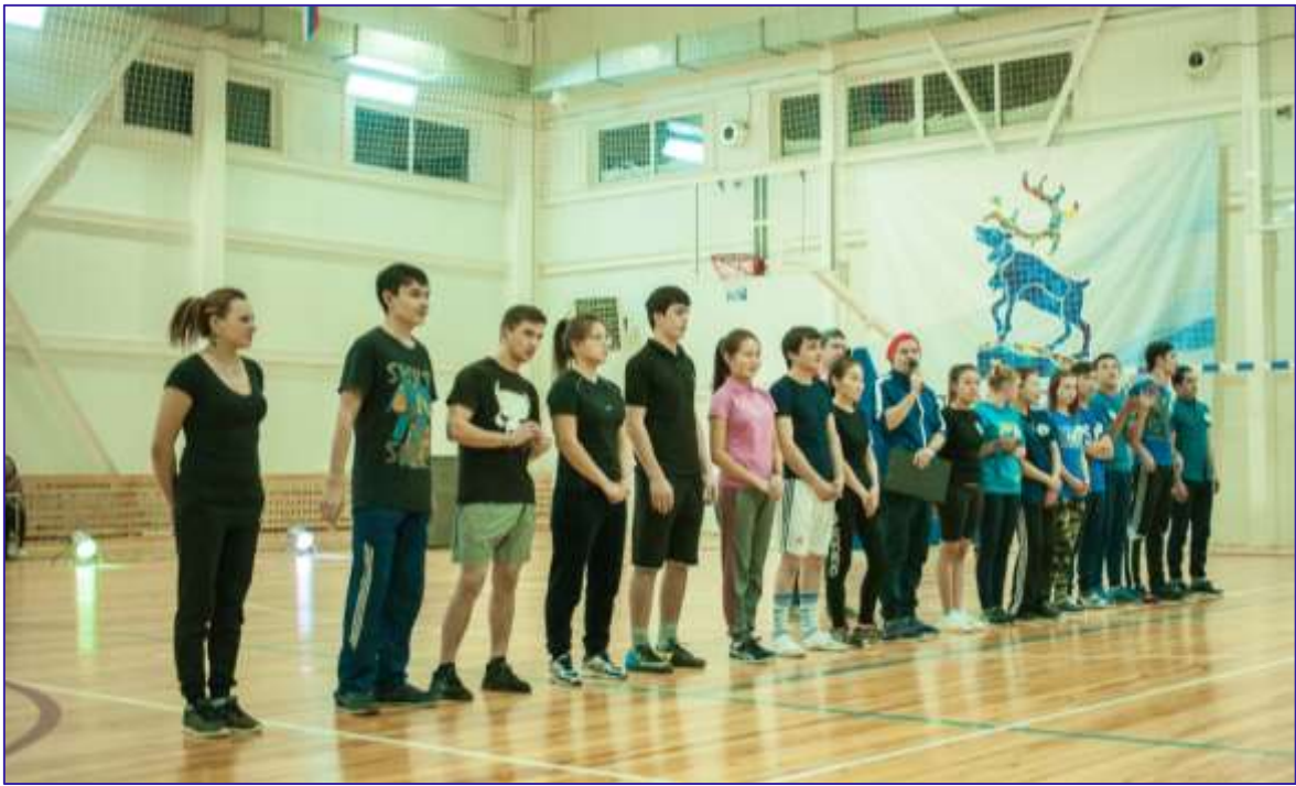
Участники спортивных соревнований в День студента -2017.