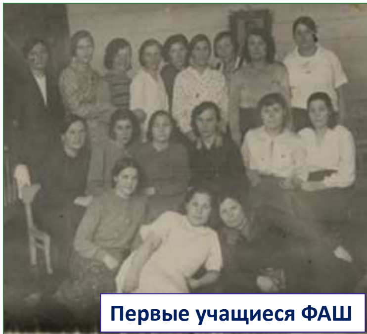
Первые учащиеся ФАШ

Становление фельдшерско-акушерской школы в тяжелые военные годы было невероятно трудным: не было собственного помещения, общежития, учебников и наглядных пособий. Летом студенты работали на сенокосе, заготавливали дрова, собирали грибы, ягоды для столовой. В 1946 году состоялся первый выпуск – 7 человек.