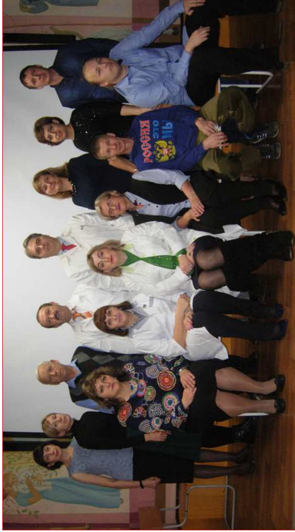
Педагогический коллектив КГБПОУ «Туринский медицинский техникум», 2018 г