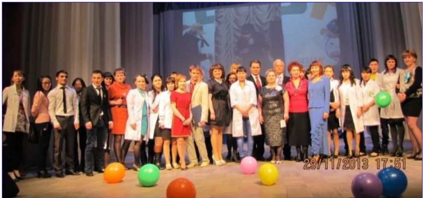
Фото предыдущего юбилея – ТМТ 70 лет.