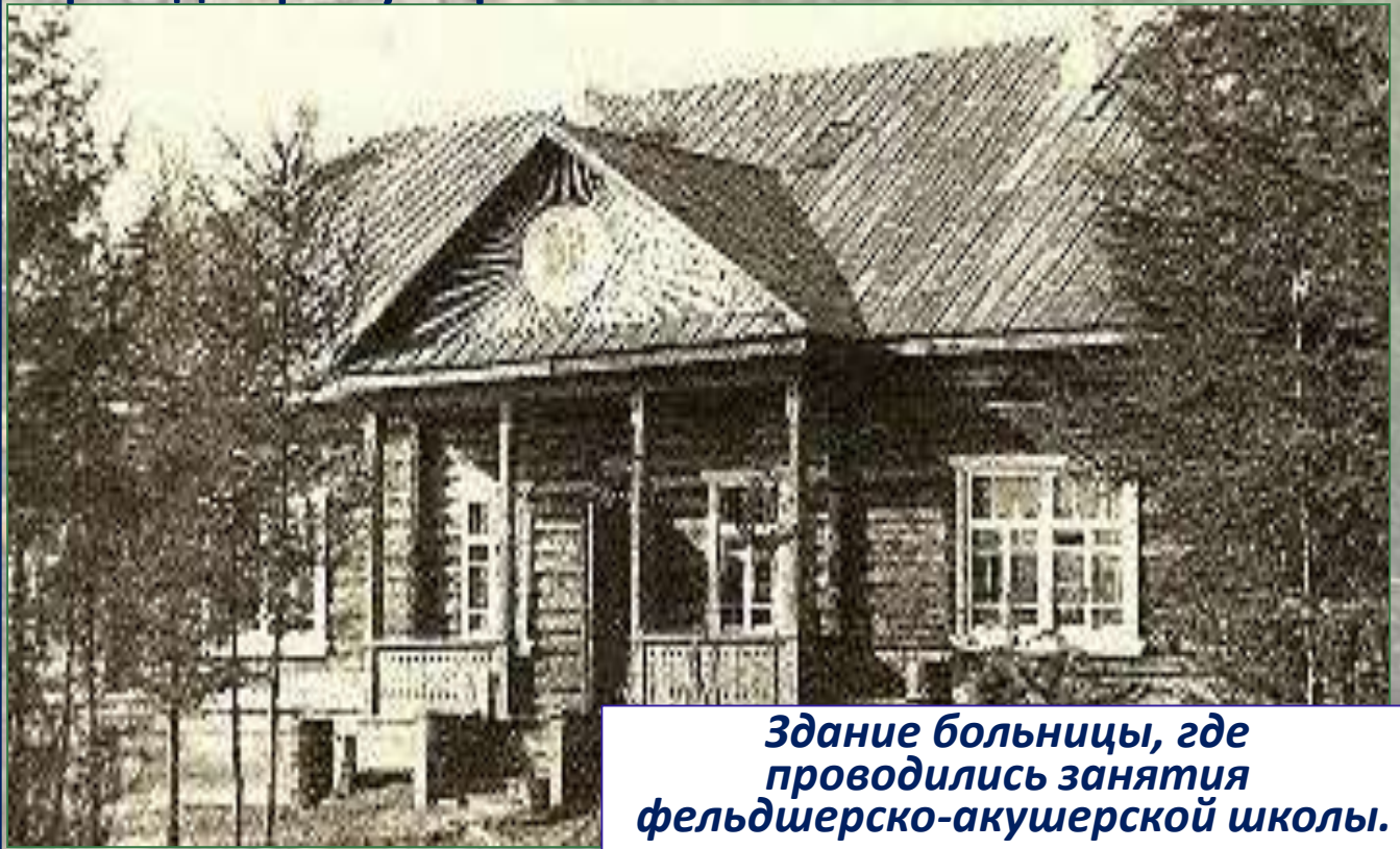
Здание больницы, где проводились занятия фельдшерско-акушерской школы.

Во время Великой Отечественной войны перед Эвенкийским национальным округом была поставлена важнейшая задача – подготовить медицинские кадры из числа коренных жителей, поэтому 19 июня 1943 года Исполнительный комитет Окружного Совета депутатов трудящихся принял решение о создании на базе Туринской районной больницы фельдшерско-акушерской школы с трехгодичным обучением с последующим присвоением квалификации «фельдшер-акушер».