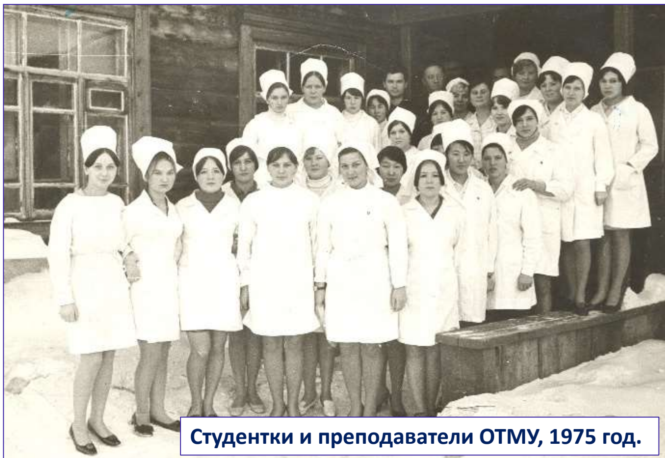
Студентки и преподаватели ОТМУ, 1975 год.

Туринский медицинский техникум является кузницей медицинских кадров из числа коренного населения, за время своего существования подготовлено 1734 квалифицированных специалистов среднего медперсонала, более 80% средних медицинских работников Эвенкийского муниципального района – выпускники Туринского медицинского техникума.