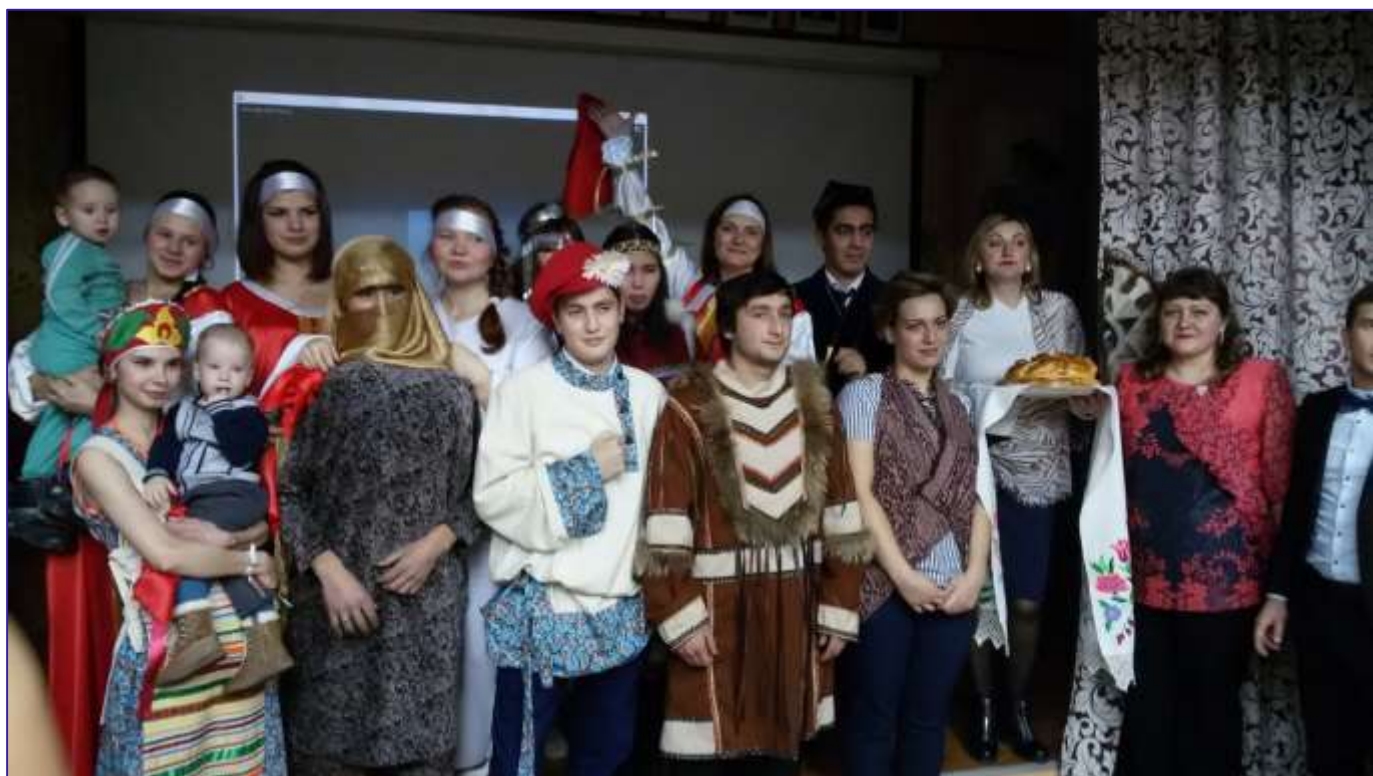
День народного единства - 2017