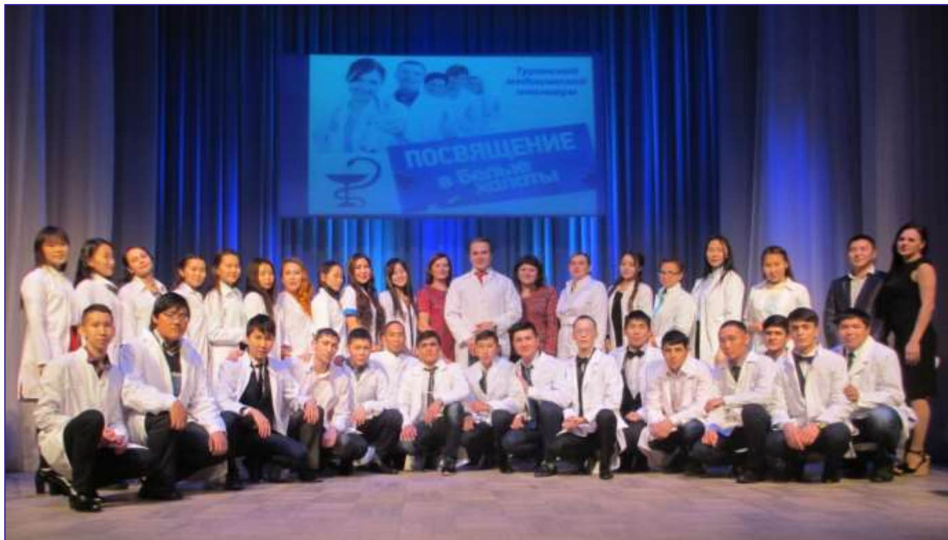
День первокурсника - 2017